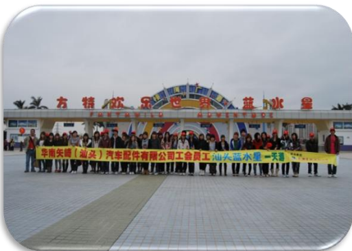
周 年 庆 典