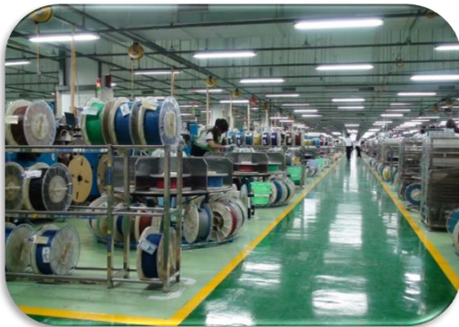
员 工 之 家